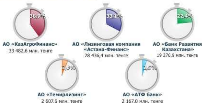
Таблица 1. Размер лизингового портфеля основных участников рынка лизинговых услуг (по состоянию на конец 2009 года)

В агропромышленном комплексе в 2009 году лизинговые операции, помимо АО «КазАгроФинанс» проводились в небольшом объеме АО «Лизинговая компания «Астана-Финанс». Учитывая, что по данным Агентства по статистике Республики Казахстан объем лизинговых услуг в сфере сельского хозяйства составил 34 899,3 млн.тенге, доля АО «КазАгроФинанс» составила 95,9%.